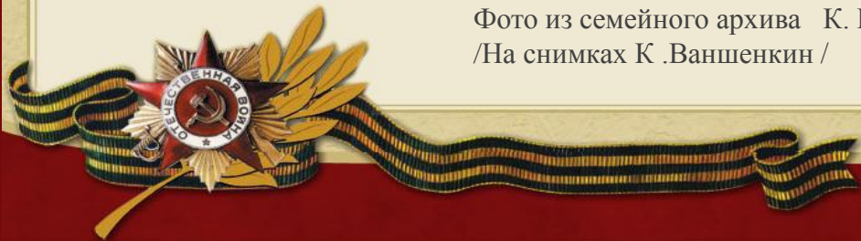
/На снимках К. Ваншенкин /

«Я родился 17 декабря 1925 года в Москве. Отец мой был инженер, а годы детства совпали с первыми пятилетками, поэтому мы подолгу жили при заводах в средней полосе России, в Сибири. Маленький городок, рабочий поселок стали потом "местом действия" многих моих стихов, да и прозы.»